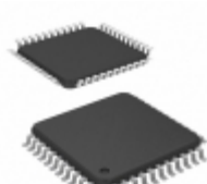
ATF1504ASVL-20AI44 Microchip Technology IC CPLD 64MC 20NS 44TQFP