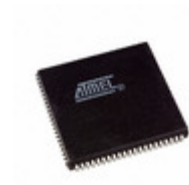
ATF1504ASVL-20JC84 Microchip Technology IC CPLD 64MC 20NS 84PLCC