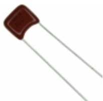
ECQ-B1331JF Panasonic Electronic Components CAP FILM 330PF 5% 100VDC RADIAL