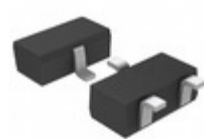
BD49K52G-TL LAPIS Semiconductor STANDARD VOLTAGE DETECTORS