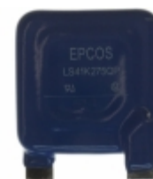
LS41K275QP EPCOS (TDK) VARISTOR 430V 50KA CHASSIS