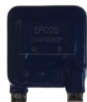
LS42K320QPK2 EPCOS (TDK) VARISTOR 510V 65KA CHASSIS