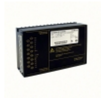
LS4301-7ER Bel AC/DC CONVERTER 12V 96W