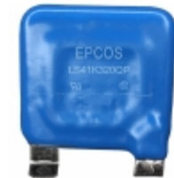
LS41K320QP EPCOS (TDK) VARISTOR 510V 50KA CHASSIS