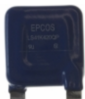
LS41K420QP EPCOS (TDK) VARISTOR 680V 50KA CHASSIS