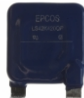
LS42K420QPK2 EPCOS (TDK) VARISTOR 680V 65KA CHASSIS