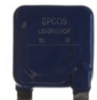
LS42K420QP EPCOS (TDK) VARISTOR 680V 65KA CHASSIS