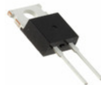
DHG5I600PA IXYS DIODE GEN PURP 600V 5A TO220AC