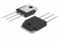
DPG60IM400QB IXYS DIODE GEN PURP 400V 60A TO3P