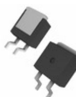
DPG60IM300PC IXYS DIODE GEN PURP 300V 60A TO263