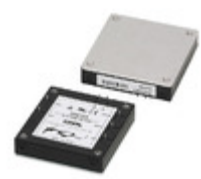
DPG750 Cosec AC/DC CONVERTER