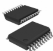
PIC16C621T-20I/SS Microchip Technology IC MCU 8BIT 1.75KB OTP 20SSOP