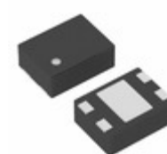
XC6118N25BGR-G Torex Semiconductor Ltd IC SUPERVISOR 2.5V 4-USP