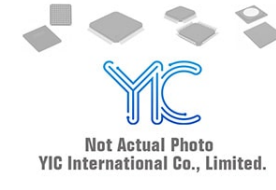
SI4464DY-TI-E3 VISHAY VISHAY SOP-8