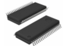
BD3814FV-E2 Rohm Semiconductor IC SOUND PROCESSOR 6CH 40SSOP