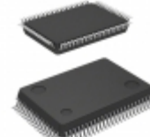
BD3816K1 Rohm Semiconductor IC SOUND PROCESSORS 80-QFP