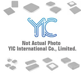
BD3824FS ROHM BD3824FS ROHM