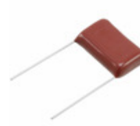
ECQ-E6474KF Panasonic Electronic Components CAP FILM 0.47UF 10% 630VDC RAD