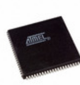
AT40K05LV-3AJI Microchip Technology IC FPGA 3.3V 256 CELL 84-PLCC