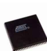
AT40K05LV-3AJC Microchip Technology IC FPGA 3.3V 256 CELL 84-PLCC