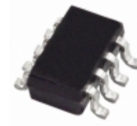
AD5680BRJZ-1REEL7 ADI (Analog Devices, Inc.) INTEGRATED CIRCUIT