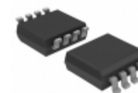
74HC3G34DC-Q100H Nexperia USA Inc. IC BUFFER NON-INV TRIPLE 8VSSOP