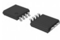
74HC3GU04DP,125 Nexperia USA Inc. IC INVERTER 8-TSSOP