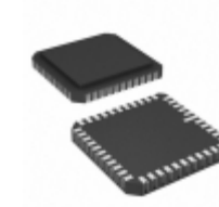
AT28HC256F-70LI Microchip Technology IC EEPROM 256KBIT 70NS 44CLCC