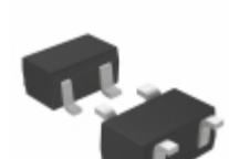
XC6119N11ANR-G Torex Semiconductor Ltd IC VOLT DET TIME DLY 1.1V SSOT-2