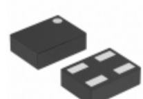
XC6119N16A7R-G Torex Semiconductor Ltd IC VOLT DET TIME DLY 1.6V 4- USPN