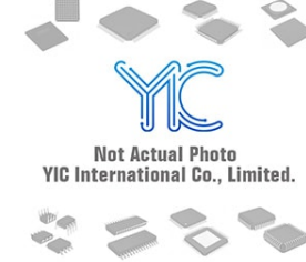
SY10EP05VZITR SYNERGY SY10EP05VZITR SYNERGY