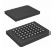
SST39VF3202-70-4C-B3KE-T Microchip Technology IC FLASH 32MBIT 70NS 48TFBGA