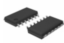
BU7444F-E2 Rohm Semiconductor IC OPAMP GROUND SENSE 8SOIC