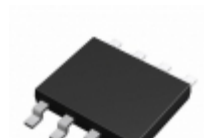
BU7462FVM-TR Rohm Semiconductor IC OPAMP GP 1MHZ 8MSOP