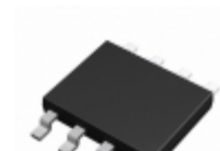
BU7442SFVM-TR Rohm Semiconductor IC OPAMP GP 600KHZ 8MSOP