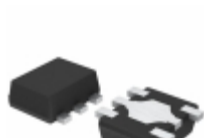
BU7445HFV-TR Rohm Semiconductor IC OPAMP GP 400KHZ RRO 5-HVSOF