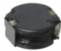
NR1005T470M Taiyo Yuden FIXED IND 47UH 1.8A 119.6 MOHM