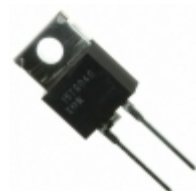
VS-20ETF04-M3 Vishay Semiconductor Diodes Division DIODE GEN PURP 400V 20A TO220AC