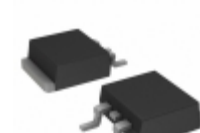
VS-20ETF02STRR-M3 Vishay Semiconductor Diodes Division DIODE GEN PURP 200V 20A TO263AB