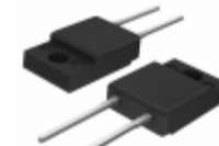
VS-20ETF04FP-M3 Electro-Films (EFI) / Vishay DIODE GEN PURP 400V 20A TO220FP