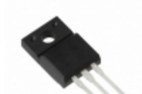
VS-20ETF04FPPBF Electro-Films (EFI) / Vishay DIODE GEN PURP 400V 20A TO220FP