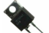
VS-20ETF04PBF Vishay Semiconductor Diodes Division DIODE GEN PURP 400V 20A TO220AC