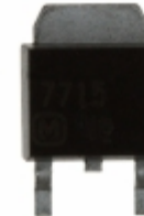
AN7715SP Panasonic Electronic Components IC REG LDO 15V 1.2A SP3SUA