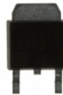
AN7709SP Panasonic Electronic Components IC REG LDO 9V 1.2A SP3SUA