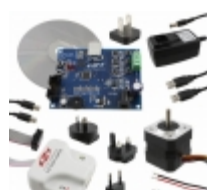
SLBLDC-MTR-RD Energy Micro (Silicon Labs) KIT REF DESIGN SENSORLESS BLDC