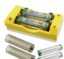
SLBC-01-YEL IXYS Corporation SOLAR BATTERY CHARGER YELLOW