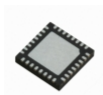
SLB9670XQ20FW760XUMA1 Infineon Technologies SECURITY IC'S/AUTHENTICATION IC'