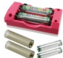
SLBC-01-PNK IXYS Corporation SOLAR BATTERY CHARGER PINK