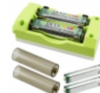
SLBC-01-GRN IXYS Corporation SOLAR BATTERY CHARGER GREEN