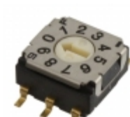
SH-7030TB Copal Electronics Inc. SW ROTARY DIP BCD COMP 100MA 5V