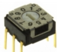
SH-7010MC Copal Electronics Inc. SWITCH ROTARY DIP BCD 100MA 5V