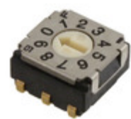
SH-7030TA Copal Electronics Inc. SW ROTARY DIP BCD COMP 100MA 5V