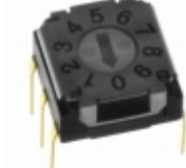
SH-7030MC Copal Electronics Inc. SW ROTARY DIP BCD COMP 100MA 5V