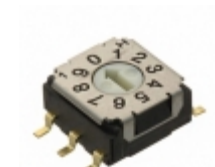
SH-7010TB Copal Electronics Inc. SWITCH ROTARY DIP BCD 100MA 5V