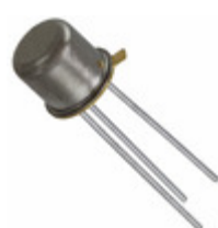
JANTX2N4029 Microsemi Corporation TRANS PNP 80V 1A TO18