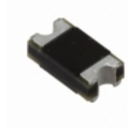
CD1408-R1400 Bourns Inc. DIODE GEN PURP 400V 1A 1408