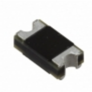
CD1408-R1200 Bourns Inc. DIODE GEN PURP 200V 1A 1408