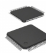
HD64738024WV Renesas Electronics America IC MCU 8BIT 32KB OTP 80TQFP