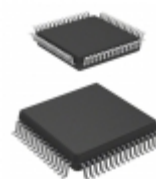
HD6473802HV Renesas Electronics America IC MCU 8BIT 16KB OTP 64QFP