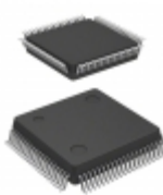
HD6473827RHV Renesas Electronics America IC MCU 8BIT 60KB OTP 80QFP