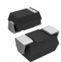
3SMAJ5948B-TP Micro Commercial Co DIODE ZENER 91V 3W DO214AC