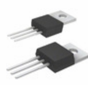
IXFP38N30X3 IXYS Corporation FET N-CHANNEL