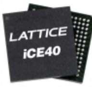
ICE40UL640-CM36AITR Lattice Semiconductor Corporation IC FPGA 26 I/O 36UCBGA