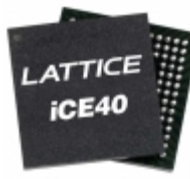
ICE40UL640-CM36AITR1K Lattice Semiconductor Corporation IC FPGA 26 I/O 36UCBGA