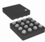
ICE40UL640-SWG16ITR1K Lattice Semiconductor Corporation IC FPGA 10 I/O 16WLCSP