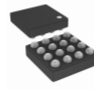
ICE40UL640-SWG16ITR50 Lattice Semiconductor Corporation IC FPGA 10 I/O 16WLCSP