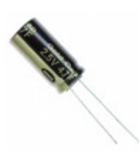
EEC-HZ0E475 Panasonic Electronic Components CAP 4.7F -20% +40% 2.5V T/H