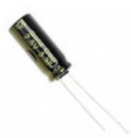
EEC-HZ0E335 Panasonic Electronic Components CAP 3.3F -20% +40% 2.5V T/H