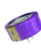
EEC-LF0H105 Panasonic CAPACITOR 1F -20% +80% 5.5V T/H