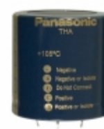
ECE-T2GA561EA Panasonic Electronic Components CAP ALUM 560UF 20% 400V SNAP