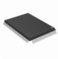
LC87F83P7PAU-QIP-E ON Semiconductor IC MCU 8BIT CAR AUDIO CTRL QFP