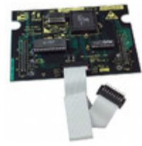
DB62X RF Solutions BOARD DAUGHTER ICEPIC