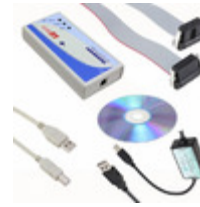
DB6510-ADM51 Maxim Integrated BOARD DEMO ENERGY MEAS 73S12XX