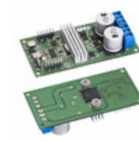
DB64 Apex Microtechnology DEMO BOARD FOR SA306-IHZ