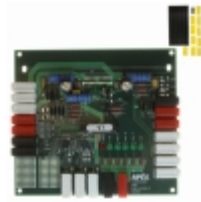
DB62 Apex Microtechnology DEMO BOARD FOR SA305EX