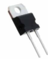
STTH30R06D STMicroelectronics DIODE GEN PURP 600V 30A TO220AC