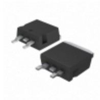
STTH30RQ06GY-TR STMicroelectronics DIODE GEN PURP 600V 30A D2PAK