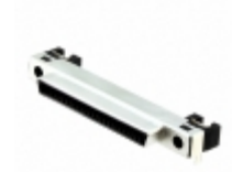
DH60-51P Hirose Electric Co Ltd CONN RCPT 51 POS R/A SMT