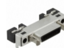
DH60A-17P Hirose Electric Co Ltd CONN RCPT 17POS R/A SMT