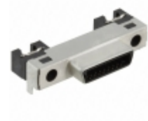
DH60-17P Hirose Electric Co Ltd CONN RCPT 17POS R/A SMT