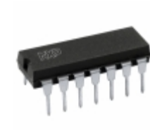
HEF4011UBP,652 NXP USA Inc. IC GATE NAND 4CH 2-INP 14-DIP