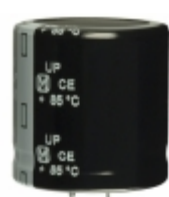
ECE-S2WP331EX Panasonic Electronic Components CAP ALUM 330UF 20% 450V SNAP