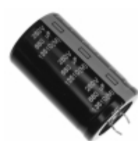
ECE-S2EU681U Panasonic Electronic Components CAP ALUM 680UF 20% 250V SNAP