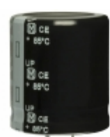
ECE-S2GP471EX Panasonic Electronic Components CAP ALUM 470UF 20% 400V SNAP