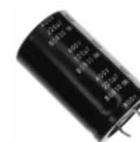
ECE-S2GG221U Panasonic Electronic Components CAP ALUM 220UF 20% 400V SNAP