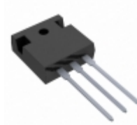
MIC29750-3.3BWT Microchip Technology IC REG LDO 3.3V 7.5A TO247-3