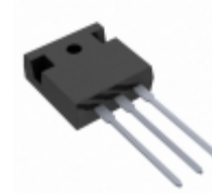
MIC29750-3.3WWT Microchip Technology IC REG LDO 3.3V 7.5A TO247-3