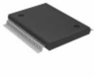
ML9272MBZ03A Rohm Semiconductor IC VFD DRIVER 40 BIT 60SSOP