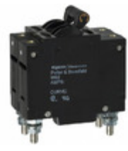
W92-X112-3 Agastat Relays / TE Connectivity CIR BRKR MAG-HYDR 3A 277VAC