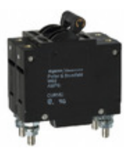
W92-X112-3 TE Connectivity Potter & Brumfield Relays CIR BRKR MAG-HYDR 3A 277VAC