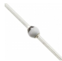
BYW172D-TR Electro-Films (EFI) / Vishay DIODE AVALANCHE 200V 3A SOD64