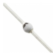
BYW172D-TAP Electro-Films (EFI) / Vishay DIODE AVALANCHE 200V 3A SOD64