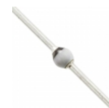
BYW172D-TAP Vishay Semiconductor Diodes Division DIODE AVALANCHE 200V 3A SOD64