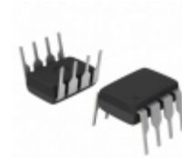
HCPL-2202 Broadcom Limited OPTOISO 3.75KV PUSH PULL 8DIP