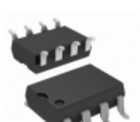
HCPL-2202#300 Broadcom Limited OPTOISO 3.75KV PUSH PULL 8DIP GW