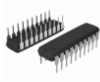
CP82C89 Intersil IC ARBITER BUS 5V 8MHZ 20-DIP