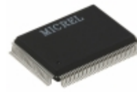
KSZ8993MI Microchip Technology IC SWITCH 10/100 W/TXRX 128QFP