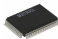
KSZ8993M Microchip Technology IC SWITCH 10/100 3PORT 128QFP