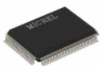
KSZ8993ML Microchip Technology IC SWITCH 10/100 W/TXRX 128QFP