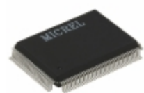
KSZ8993I Microchip Technology IC SWITCH 10/100 3PORT 128QFP