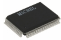
KSZ8995FQ Microchip Technology IC SWITCH 10/100 5PORT 128QFP