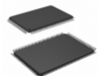
KSZ8993M-TR Microchip Technology IC SWITCH 10/100 3PORT 128QFP