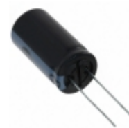
EEC-A0EL106 Panasonic Electronic Components CAP 10F -20% +80% 2.5V T/H