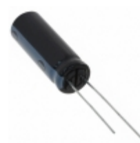
EEC-A0EL475 Panasonic Electronic Components CAP 4.7F -20% +80% 2.5V T/H