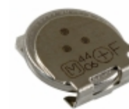
EEC-EN0F204J1 Panasonic Electronic Components CAP 200MF -20% +80% 3.3V SMD