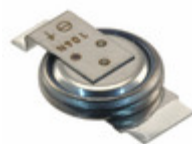
EEC-EN0F204AK Panasonic Electronic Components CAP 200MF -20% +80% 3.3V SMD