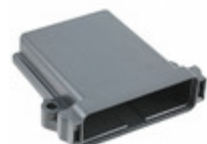
EEC-325X4B Agastat Relays / TE Connectivity DTM ENCLOSURE BLK