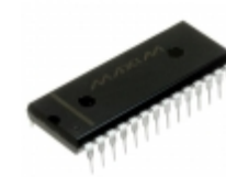
MAX263ACPI Maxim Integrated IC FILTER SW CAP BANDPASS 28-DIP