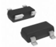
MAX2632EUS-T Maxim Integrated IC AMP LN 3V VHF/MICRO SOT143-4