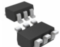
MAX2634AXT/V+T Maxim Integrated IC AMP LOW NOISE AUTO RKE SC70-6