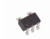
MAX2632EUK-T Maxim Integrated IC AMP 3V VHF/MICROWAVE SOT23-5