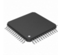
PSD834F2-70M STMicroelectronics IC FLASH 2MBIT 70NS 52QFP