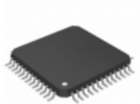
PSD834F2V-20MI STMicroelectronics IC FLASH 2MBIT 200NS 52QFP