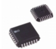
AD7669JPZ Analog Devices Inc. IC I/O PORT 8BIT ANLG 28-PLCC