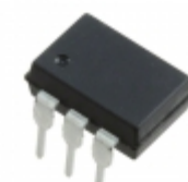
ASSR-1511-001E Broadcom Limited RELAY SSR SPST SGL 1.0A 6DIP