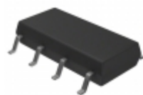
ASSR-1530-005E Broadcom Limited RELAY SSR 1.0A 60V 8SO