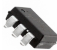
ASSR-1511-501E Broadcom Limited RELAY SSR SPST SGL 1.0A 6SMD GW